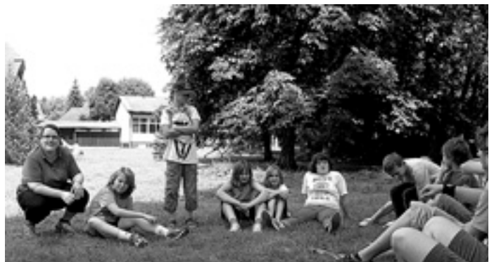
Teambesprechung bei der Musikerolympiade

Alle Musiker fanden sich dazu gemeinsam im großen Probersaal ein und Jungmusiker und Zöglinge übten gemeinsam ein neues Musikstück ein. Unsere mittlerweile schon traditionelle Abendsere-nade wollten wir natürlich auch beibehalten. Hierzu übt zum Abschluss eines Tages immer eine Gruppe selbständig ein Musikstück