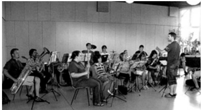
Die erste gemeinsame Probe

Wir bekamen wieder »unser« Waldhaus zugeteilt, in dem wir schon im letzten Jahr untergebracht waren. Hier waren wir unter uns und konnten unserer Kreativität freien Lauf lassen. Die Zimmer wurden verteilt und jeder musste sein Bett beziehen. Hier traten dann die ersten Schwierigkeiten auf und der Kampf mit den Bettlaken und Kissenbezügen war legendär. Nach einer kurzen Unterweisung durch die Betreuer wurde aber auch diese Hürde schnell gemeistert. Nach soviel Aufregung kam dann die nachmittägliche Ruhepause grade richtig. Die Zeit bis zum Abendessen stand zur freien Verfügung und so konnte jeder selbst entscheiden, ob er sich ausruhen wollte, oder doch lieber mit den anderen spielen wollte. Nach dem Abendessen stand dann die erste Probe auf dem Programm.