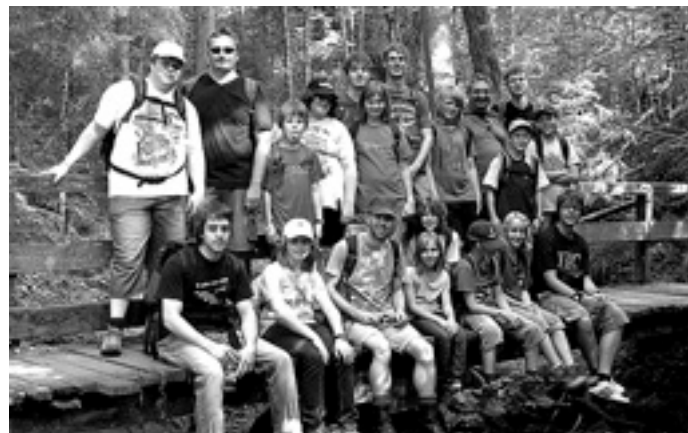
Auf dem Weg in die Wutachschlucht

Nachdem sie in den ersten zwei Tagen die Jugendherberge bezogen hatten und ihr Können bei einer Musikerolympiade unter Beweis stellten, stand am Montag der erste große Ausflug an: Gemeinsam durchwanderten die Jugendlichen und die Betreuer die bekannte Wutachschlucht, die nur wenige Kilometer hinter der Jugendherberge begann. Zügig wurde die Einstiegsstelle erreicht und durch eine enge und steinige Klamm in die Schlucht hinunter gestiegen. An der Wutach entlang wurde es um einiges gemüthlicher und trotz des warmen Wetters war es bei der Wanderung angenehm kühl und man kam nur manchmal ins Schwitzen wenn es