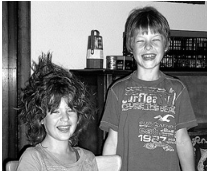
Profi am Werk

Am Dienstag stand ein Besuch im Frei- und Seebad am Schluchsee auf dem Programm, doch bevor sich die Jugendlichen in die Fluten stürzen und die große Rutsche ausprobieren konnten, stand am Vormittag erst einmal eine kleine Probe auf dem Programm. Vom Baden waren dann alle begeistert und bei dem schwülen und heißen Wetter kam diese Abkühlung gerade richtig. Nach einer Probe am Abend und der letzten Abendserenade, gab es einen kleinen »Bunten Abend« bei dem die Sieger der Olympiade geehrt wurden, die lustigsten Szenen des Jugendlagers nachgespielt und von einigen gegenseitig die Haare umgestylt wurden.