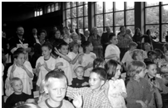
Die Halle in Bewegung