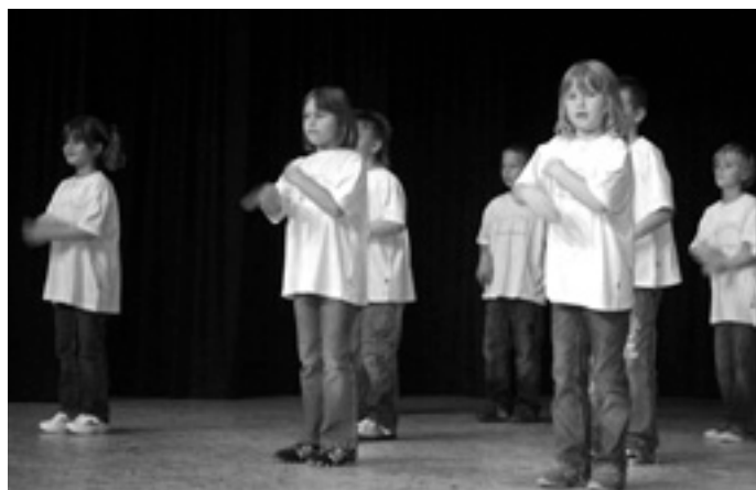
»Schaut her - so geht's!«

Nach dieser Bewegungseinlage trug die Klasse 3 ihr Gedicht über die zuckersüße Schultüte, in die viele Dinge und gute Wünsche für die Neulinge gesteckt wurden, vor. Ihren Vortrag rundeten sie mit einem englischen Lied ab. Zu guterletzt tanzten die Mädchen der Klasse 4 in einer Neubesetzung zur Melodie »Go-West« - dieser Tanz hatte schon beim Schulfest das Publikum mitgerissen! Und auch dieses Mal ertanzten sich die Mädels einen riesigen Beifall.