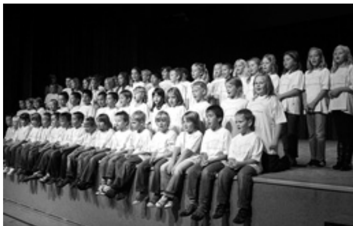
»Heute kommst du in die Schule«