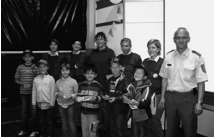
Besuch der Bereitschaftspolizei