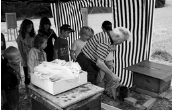
Besuch beim Imker