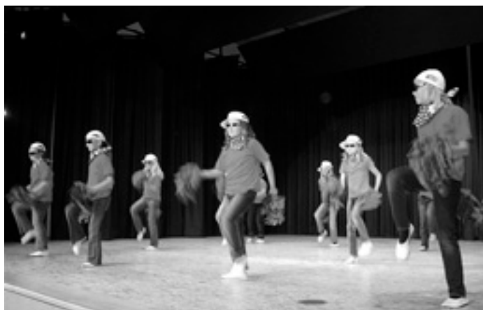
»Go-West« - heißt die Devise

Begrüßt wurden alle Anwesenden nach dem »Einzug« der einzelnen Klassen mit dem Lied: »Heute kommst du in die Schule.«. Anschließend folgte der »Oakie - Dokie« Tanz der Klasse 2, der schon beim Schulfest gut angekommen war. Durch die geforderte Zugabe kam der ganze Saal in Bewegung und alle hatten einen Riesenspaß!