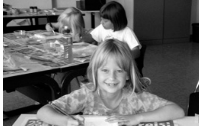
Malen mit Gouache