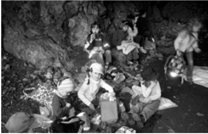
Vesper im Hohlensteinstadel

scheinlich schon die Steinzeitmenschen um das Feuer gegessen waren.