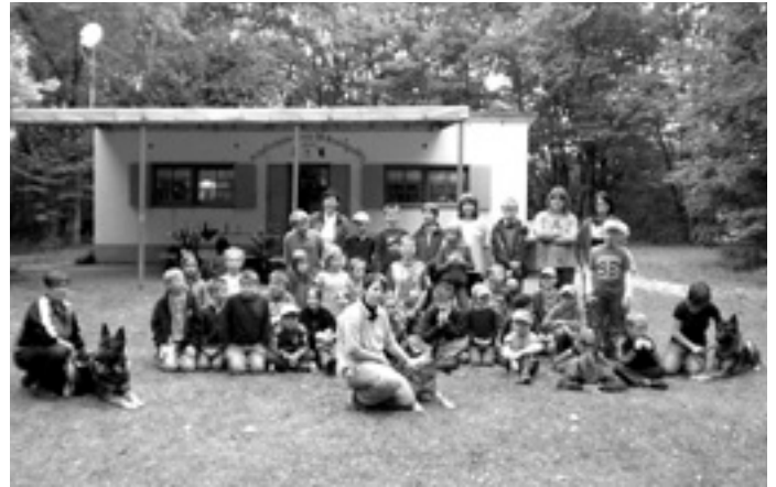
Nachmittag mit Rex

Unter www.boehmenkirch.de/RathausAktuell/Schülerferienprogramm haben wir Bilder ins Netz gestellt, die Sie herunterladen können.