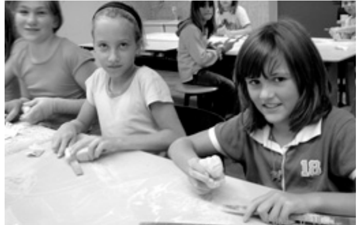
Speckstein - in jedem steckt ein Künstler