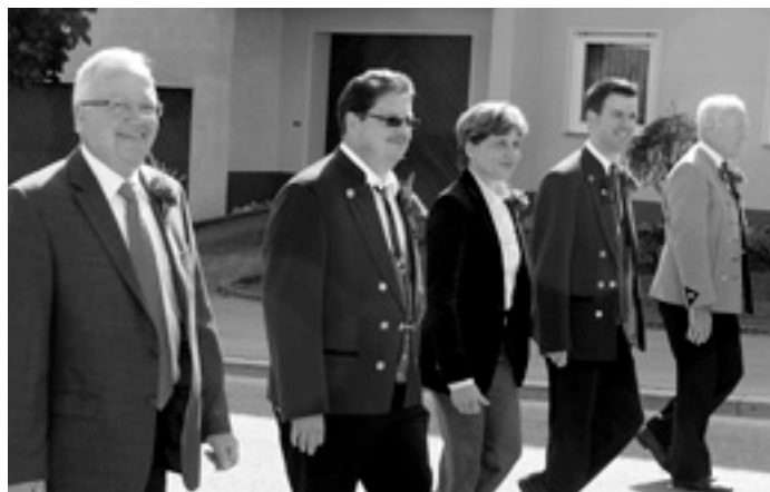
Festkomitee des Lautertalmusikerrings