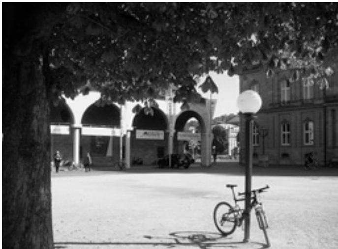
Vor dem Kunstgebäude am Schlossplatz

Am 7. Oktober besuchten die Vorschüler des Katholischen Kindergartens Böhmenkirch die große Eiszeit-Ausstellung in Stuttgart. Dieser Besuch war der Höhepunkt des schon einige Wochen dauernden Steinzeitprojekts. Zur Vorbereitung waren die Kinder im September im Lonetal unterwegs, um sich mit der Gegend vertraut zu machen, in der die eiszeitlichen Jäger und Sammler vor ungefähr 30 000 Jahren lebten. Dort wurden in der Vogelherdhöhle und im Hohlenstein-Stadel viele der Kunst- und Gebrauchsgegenstände gefunden, die in der Ausstellung zu sehen sind. Auch im Kindergarten näherten sich die Kinder diesem Thema, in dem sie etwa Höhlenbilder auf Schiefer malten, Schwirrhölzer bastelten, ihre eigene kleine Steinzeitwelt schufen oder sich im Steinzeitzelt aufhalten konnten. Herr Rolf Fuchs baute mit den Kindern eine Miniaturhöhle, die liebevoll ausgestaltet wurde. Natürlich gab es viele Bilderbücher und auch eine DVD zum Thema.