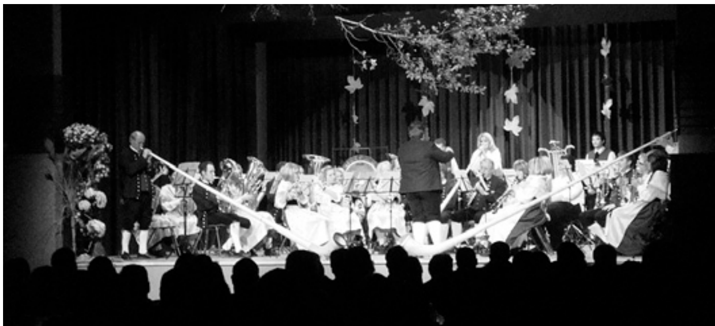
Hier die Trachtenkapelle Treffelhausen bei »Begegnung« - mit ihren Solisten an den Alphörnern.