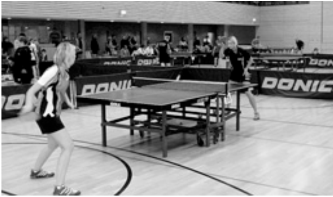
Bezirksmeisterin in Aktion (Endspiel)