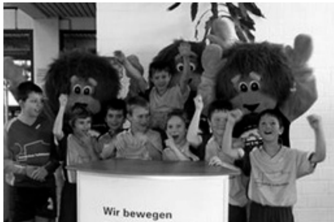
Unsere tolle Mannschaft