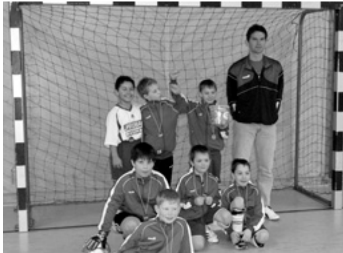
Geschafft: Der Pott gehört uns!