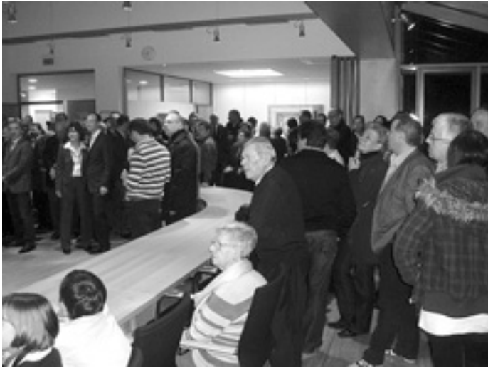
Die Spannung war spürbar: Rund 150 Bürger, darunter zahlreiche Gemeinde- und Ortschaftsräte, warteten im Sitzungssaal des Rathauses auf das Wahlergebnis.