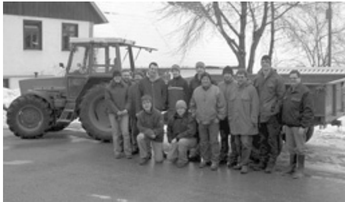
Leider nicht auf dem Bild: Heike Mutzhaus