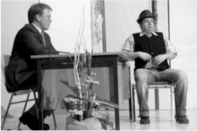
Hannes und der Bürgermeister