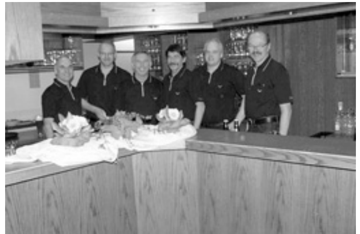
Fleißige Helfer hinter der Theke