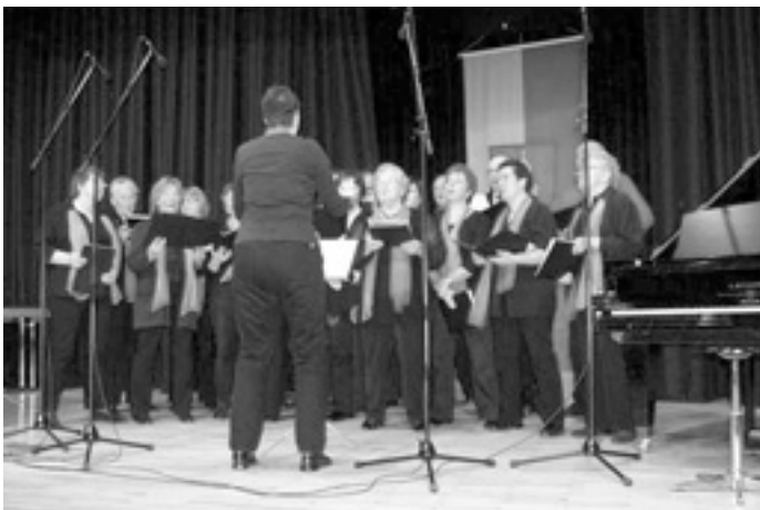
Gemischter Chor Steinenkirch