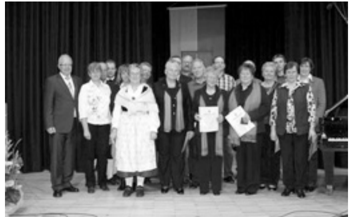
Sänger und Musiker