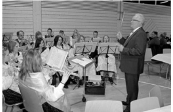
Original Schwäbische Trachtenkapelle unter neuem Dirigat