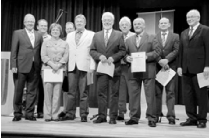
Bürgermedaille, Ehrennadel des Landes