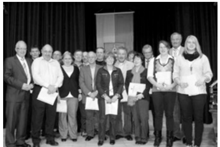
Sportler, Schützen, Feuerwehr, DRK, CDU, Laienspieler, Kulturring