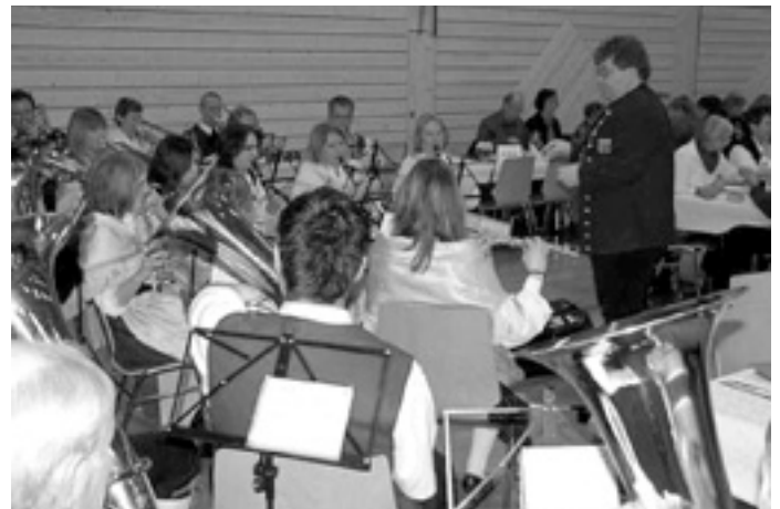
Original Schwäbische Trachtenkapelle