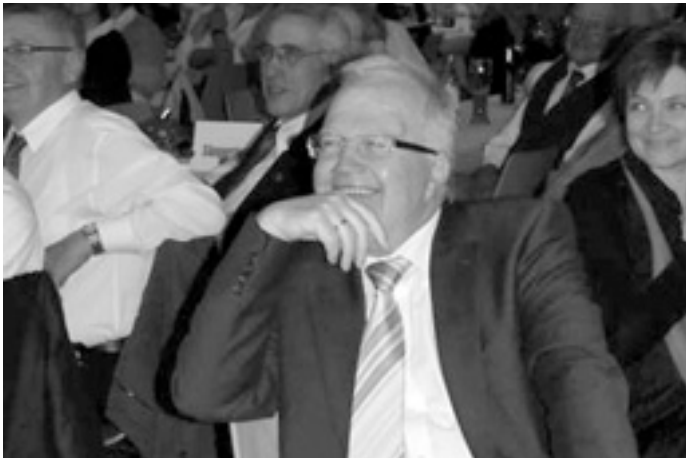
Ein glücklicher Bürgermeister