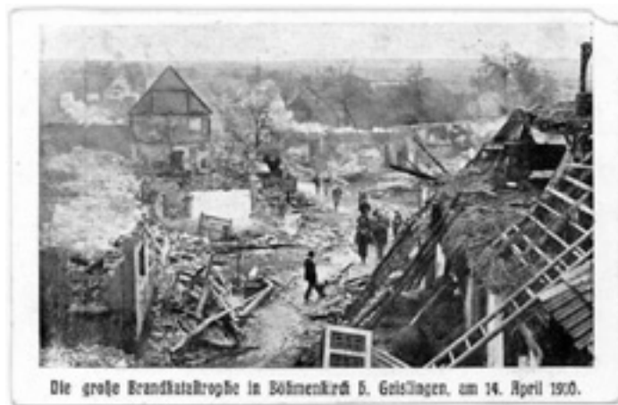
Die große Brandkatastrophe in Böhmenkirch 5. Geislingen, am 14. April 1910.

Die Feuerwehren, zunächst die des Orts, später auch die der umliegenden Gemeinden, standen dem Unglück fast hilflos gegenüber, denn Wassermangel behinderten die Löscharbeiten. Der Gussenstadter Feuerwehr war es mit ihrer besonderen Löscheinrichtung möglich, mit Gülle zu spritzen. Die Feuerwehr musste, um der Lage Herr zu werden, sich auf das Einreißen von Gebäuden beschränken, um Gassen in dem Inferno zu schaffen. Viele, die eben noch halfen, bei anderen den Brand zu bekämpfen, merkten nicht, dass Zuhause durch Funkenflug schon das eigene Dach in Flammen stand. Am Schluss waren 354 Personen von heute auf morgen obdachlos. Gebäude, Fahrnisse und Futtermaterialien waren verloren. Gerettet werden konnte außer dem Vieh so gut wie nichts.