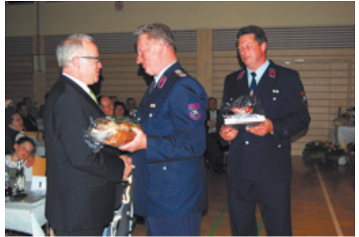
Abschiedsgrüße aus Berthelsdorf