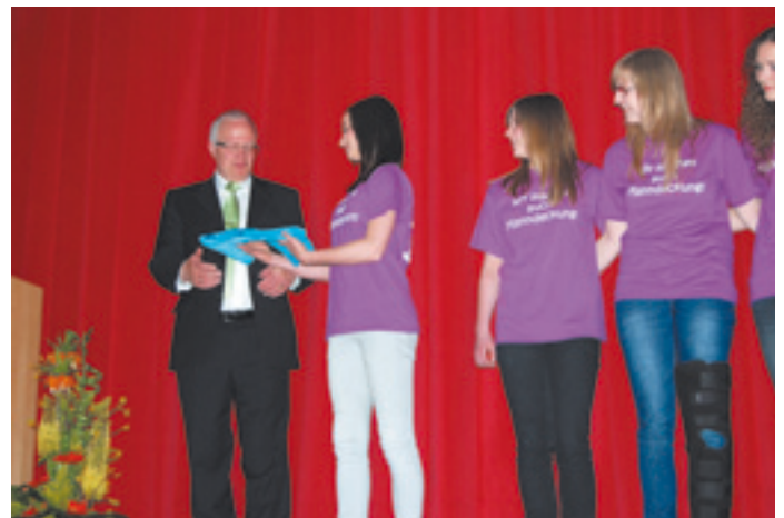
Ein T-Shirt für den »Sponsor« der Handballerinnen