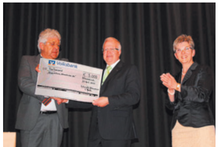
Großzügiger Spendenscheck der Vereine