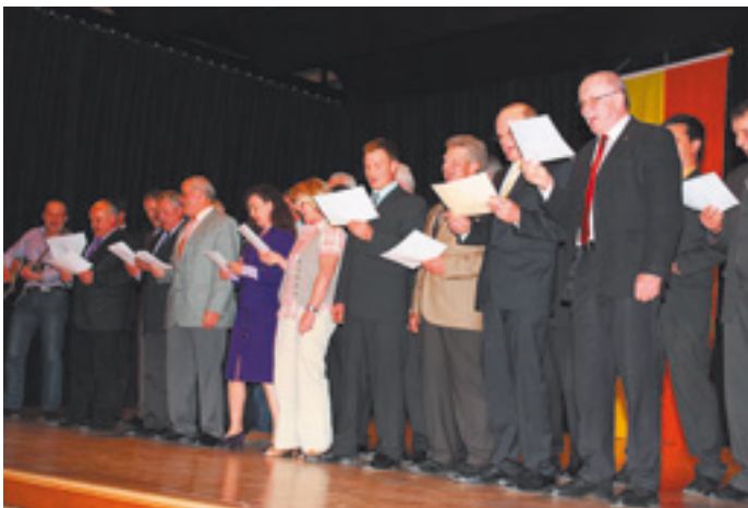
Der Gemeinderats-Chor gibt sein Bestes