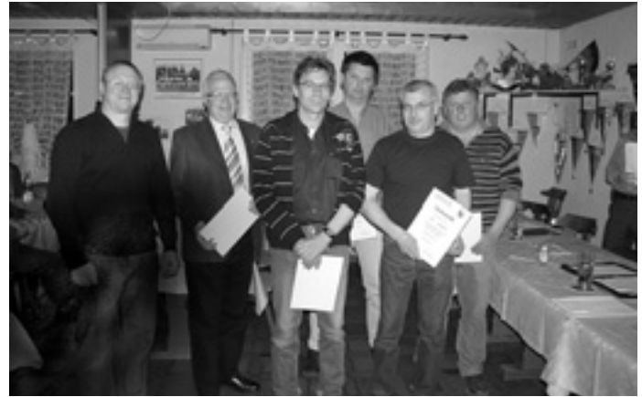
Ehrungen 25 Jahre