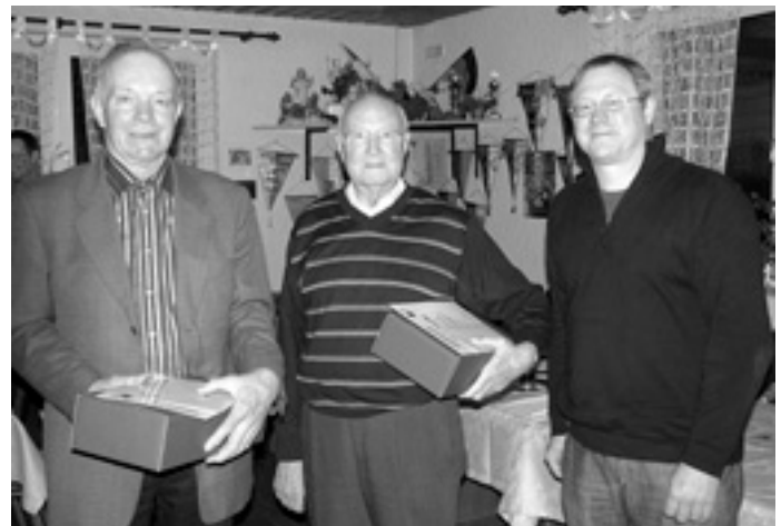
Ehrungen 50 Jahre