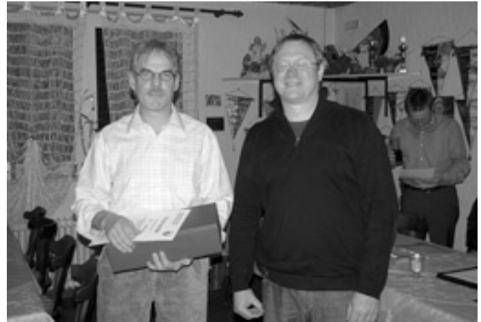
Ehrungen 40 Jahre