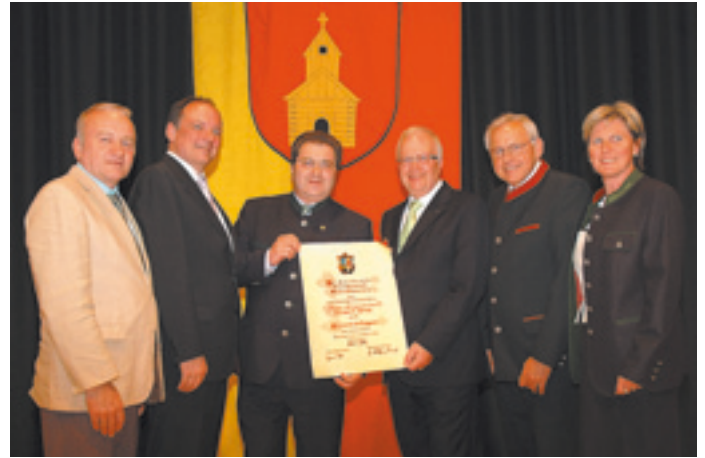
Böheimkirchen hat einen neuen Ehrenbürger