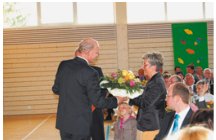
Blumen für Frau Lenz