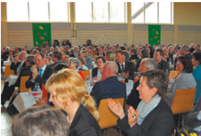
Ein gut gelauntes Publikum