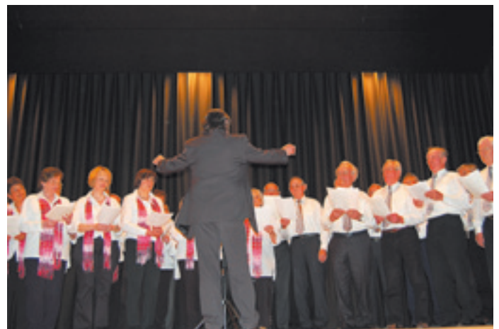
Der Liederkranz mit frischen Weisen