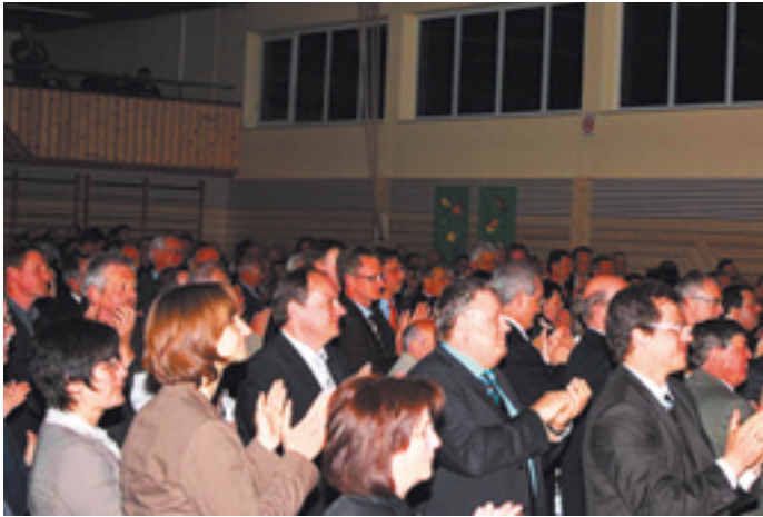
Standing Ovations für Bürgermeister Lenz