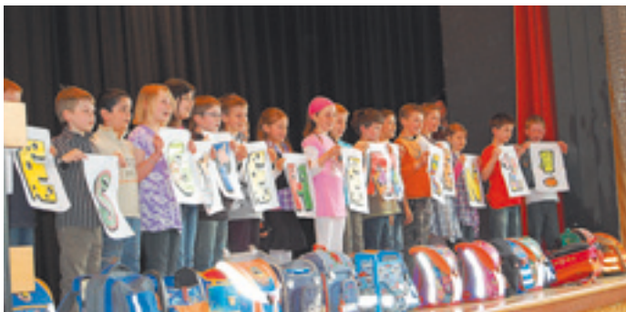
Hausaufgabenhilfe durch die Klasse 3b