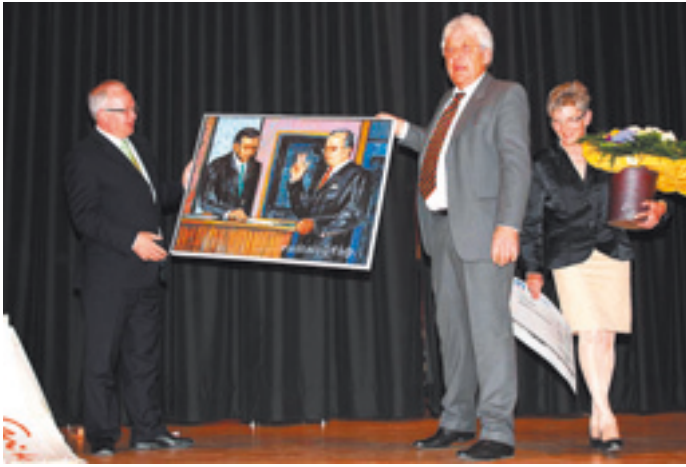
Künstlerportrait von Artur Steck