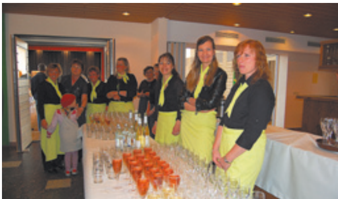
Freundlicher Empfang durch die Landfrauen Steinenkirch