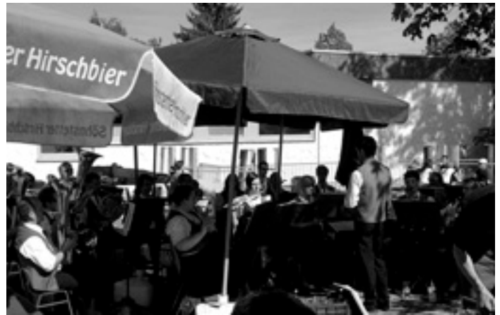
Der Musikverein »Frisch Auf« Böhmenkirch e.V.