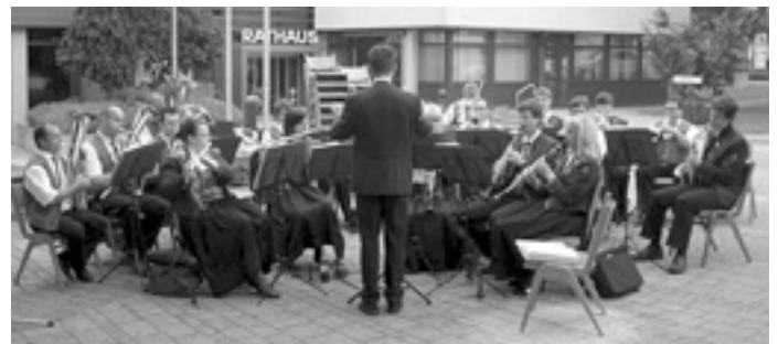
Die Musiker auf dem Hock

Anfangs bei trockenem Wetter, spielte der Musikverein von 11.00 Uhr bis 14:00 Uhr unter freiem Himmel auf dem Musiker-Hock vor dem Rathaus in Gingen auf. Als mit fortschreitender Zeit der bald einsetzende Nieselregen immer stärker wurde, wurden zunächst Sonnenschirme aufgestellt, die aber dem bald strömenden Regen nicht lange standhalten konnten. Zunächst hielten die Musiker noch tapfer stand und spielten noch zwei Stücke, bis sie sich kurz vor Spielende den Naturgewalten beugen mussten.