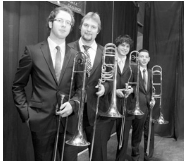
Das Posaunen-Quartett wird zusammen mit dem Saxophon-Quartett das Kur-Konzert am 20. Juni im Kurpark Bad Überkingen gestalten.

Das Konzert findet nur bei gutem Wetter statt. Der Eintritt ist frei.