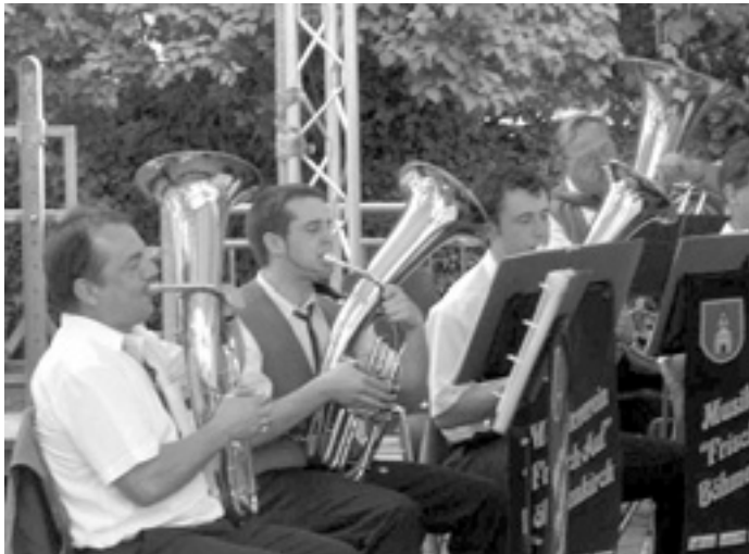
Die Tenorhörner und der Bass trotzten der Hitze.

Am vergangenen Sonntag spielten die Musiker unter der drückenden Hitze auf dem Stadtfest in Süßen. Die Musiker aus Süßen sorgten uns mit reichlich Flüssigkeit, vielen herzlichen Dank dafür. Zwischendurch konnten wir uns am vorbeifließenden Bächle abkühlen.