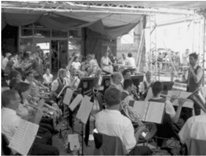
Die Musiker auf dem Stadtfest

Am vergangenen Sonntag spielten die Musiker unter der drückenden Hitze auf dem Stadtfest in Süßen. Die Musiker aus Süßen sorgten uns mit reichlich Flüssigkeit, vielen herzlichen Dank dafür. Zwischendurch konnten wir uns am vorbeifließenden Bächle abkühlen.