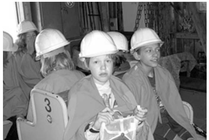
Einfahrt in den Tiefen Stollen