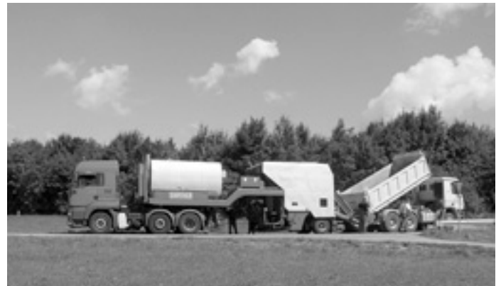
Auch auf der Zillerforststeige hat man Reparaturarbeiten durchgeführt.