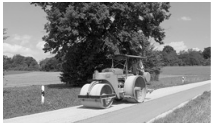
Anschließend kam das »Kaelble«, die Straßenwalze des Bauhofs, zum Einsatz, um den Splitt festzuwalzen.